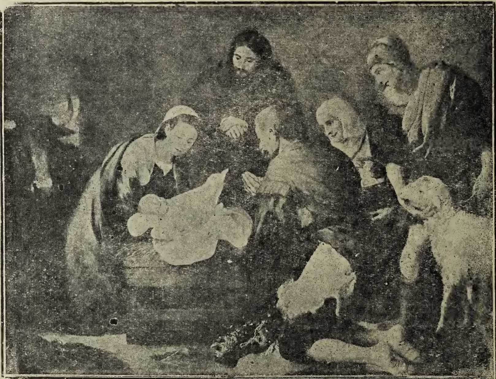
ADORAÇÃO DOS PASTORES EM BELÉM

Uma religião que estabelece o princípio das almas num mundo como o nosso, do nascimento à morte e fixa o seu futuro entre as alternativas de um inferno perpétuo e de um estado paradisíaco num céu abstrato, não póde orientar aqueles que sentem o seu coração palpitar pela Imor-